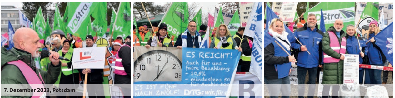
7. Dezember 2023, Potsdam