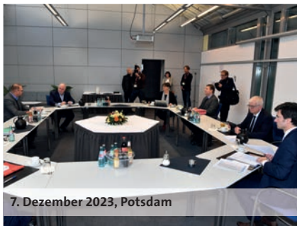
7. Dezember 2023, Potsdam