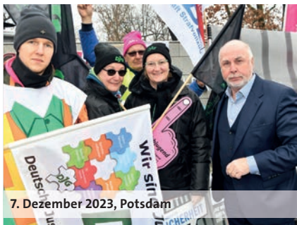
7. Dezember 2023, Potsdam