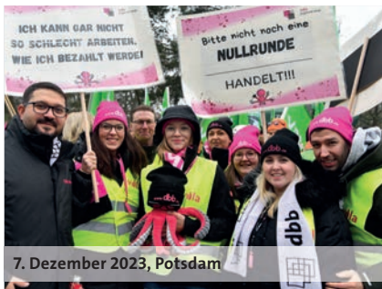
7. Dezember 2023, Potsdam

Beschäftigte in der Sozialen Arbeit in den Stadtstaaten erhalten eine monatliche SuE-Zulage in Höhe von 180,00 Euro. Diese Zulagen werden ab dem 1. Januar 2024 gezahlt.