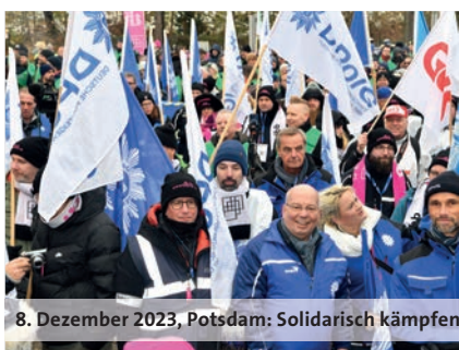
8. Dezember 2023, Potsdam: Solidarisch kämpfen GDL und dbb für ihre Ziele