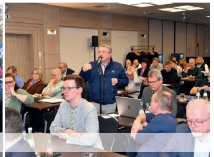
8. Dezember 2023, Potsdam: Solidarisch kämpfen GDL und dbb für ihre Ziele